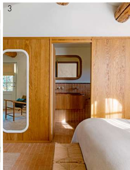
Anais Boileau, Yannick Labrousse